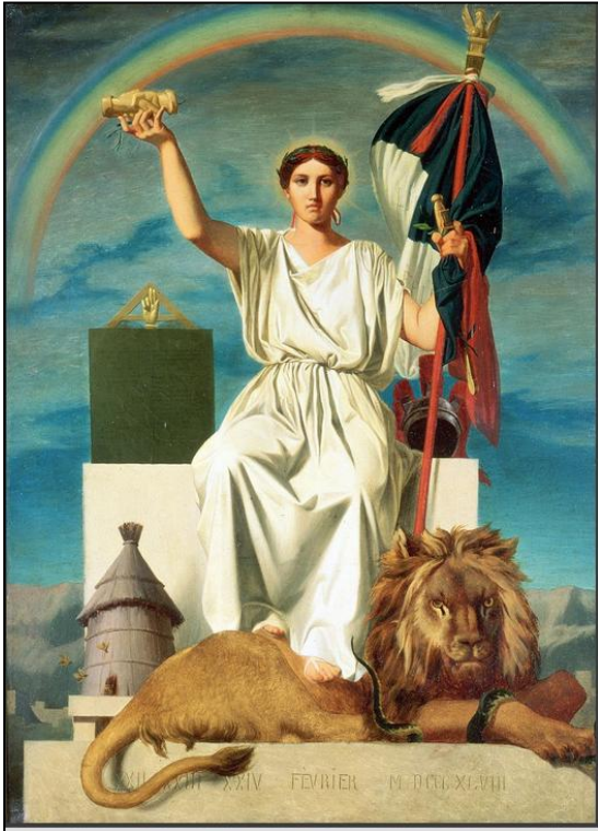
Doc1 : La République, 1848