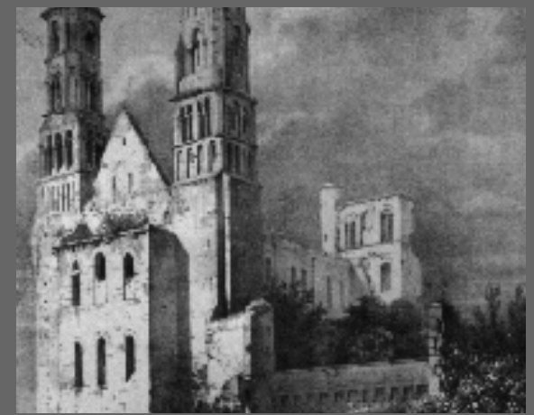
Peinture de L'abbaye de Jumièges

Fondée vers 654 par saint Philibert, l'abbaye applique dès ses débuts la règle de saint Benoît et connaît un essor très rapide. Dès 841, elle est dévastée par les Vikings, dont les raids obligent les moines à abandonner le site pendant presque 10 ans. Après le départ des derniers moines en 1790, les bâtiments seront vendus comme bien national et serviront de carrière de pierre de 1796 à 1824. Les ruines seront ensuite entretenues grâce au rachat en 1853 par la famille Lepel-Cointet, puis par l'Etat en 1946. L'abbaye de Jumièges est devenue propriété du Département de Seine-Maritime en 2007.