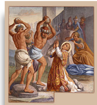
Lapidation de Saint-Etienne Peinture du XIXème siècle

La cathédrale de Bourges porte le nom de Saint-Etienne. Ce saint est considéré comme le premier martyr. Il mourut lapidé.